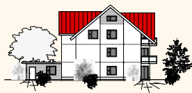
NORD - WESTEN