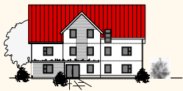
NORD - OSTEN